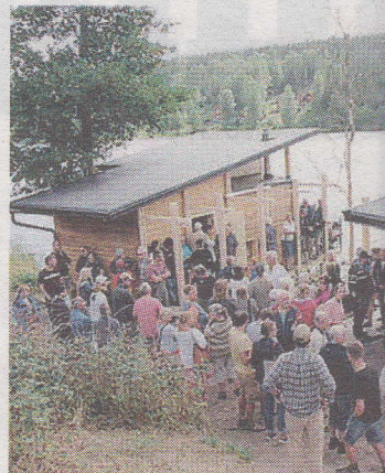
Mycket folk slöt upp för att vara m...