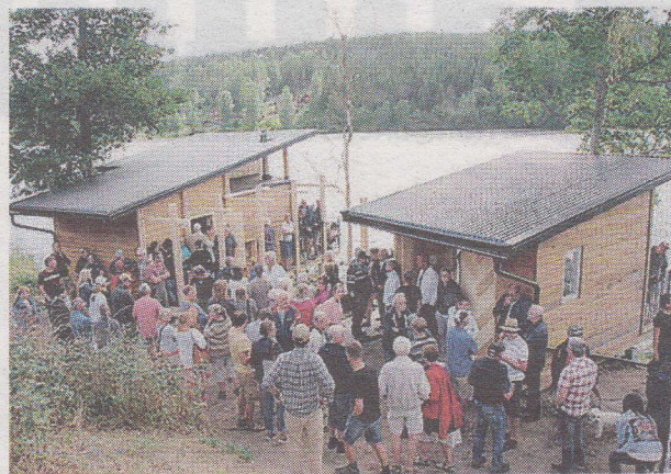
Mycket folk slöt upp för att vara med på invigningen.