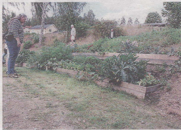
Ett trädgårdsland har anlagts.