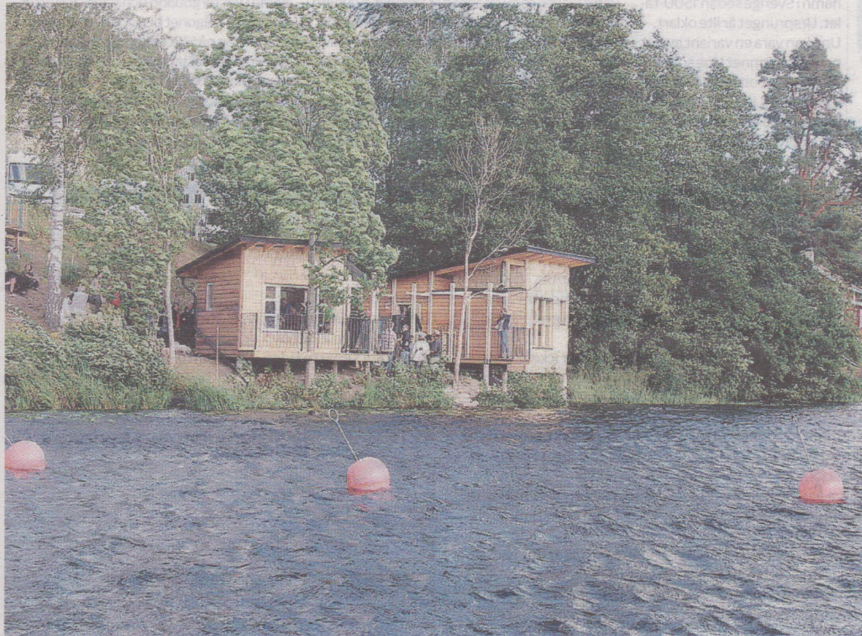
Den nya mötesplatsen i Dals Långed ligger naturskönt i slänten ner mot Katrineholmshöljen.