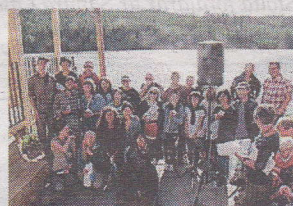
Studenter och projektledare.