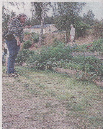
Ett trädgårdsland har anlagts.