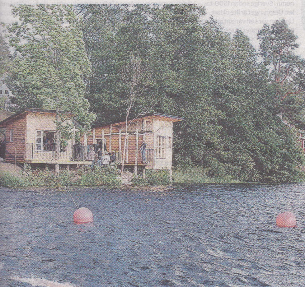
Dals Långed ligger naturskönt i slätten ner mot Katrineholmshöljen.

SLÅNGED. Ett landmärke och rekreationsområde har blivit verklighet